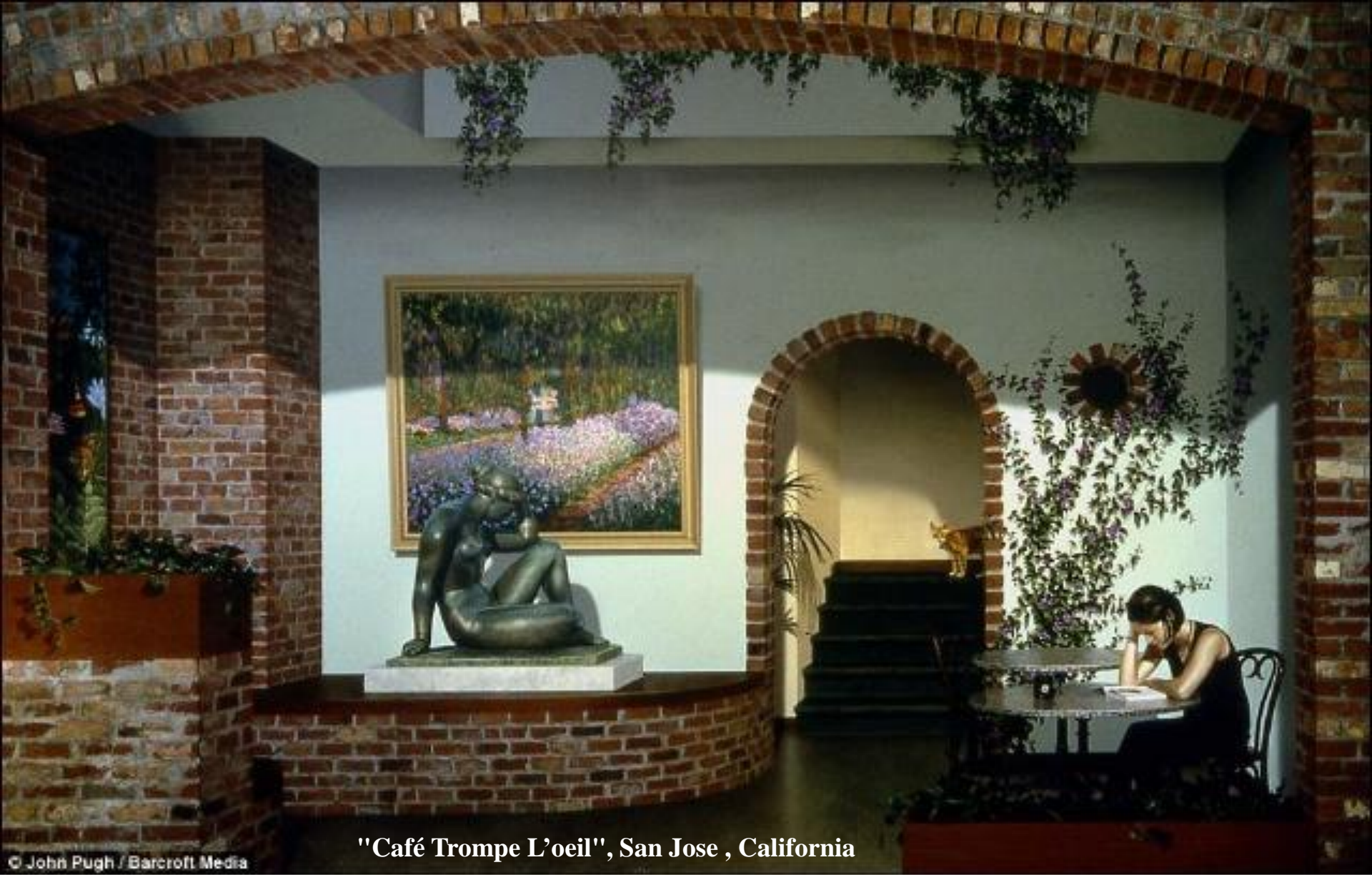
"Café Trompe L'oeil", San Jose , California

Peinture murale qui s'appelle : "L'Art qui imite la vie qui à son tour imite l'Art qui imite la vie". La cliente à la table est peinte, et... elle ne quitte pas sa place à l'heure de fermeture.