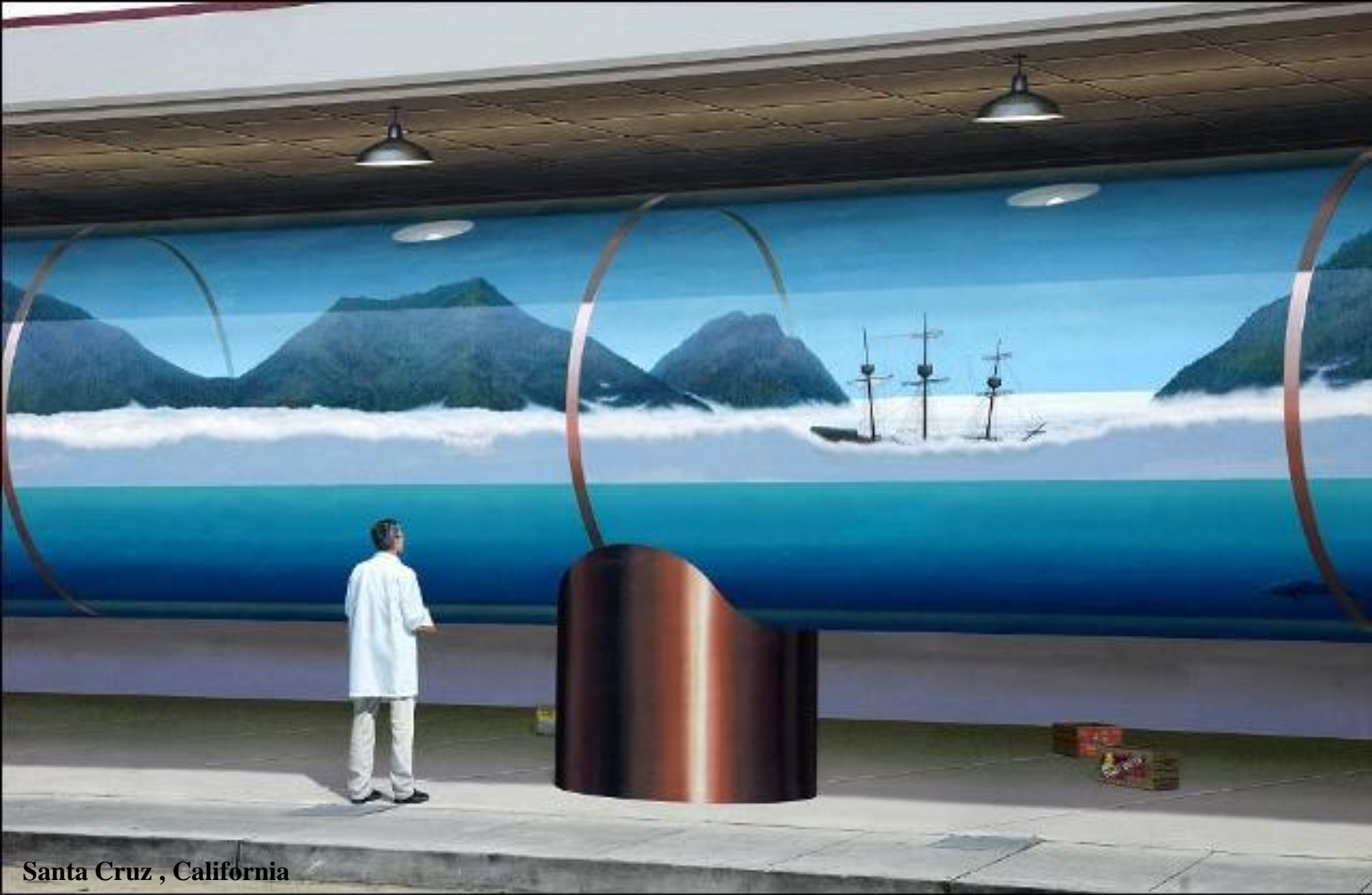
Santa Cruz , California

Baie dans une bouteille : même le spectateur fait partie de la peinture