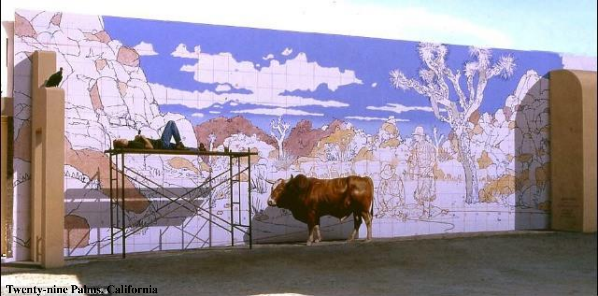
Twenty-nine Palms, California

Valentin le taureau et un voutour attendent que l'artiste se réveille.