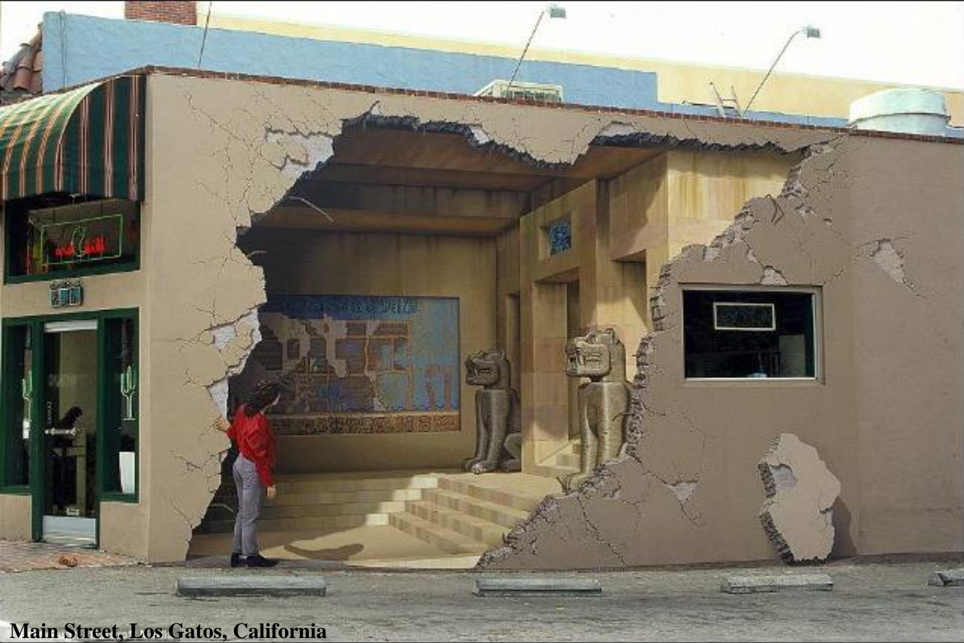
Main Street, Los Gatos, California